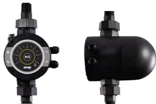
Frekvenční měnič VIFIDI BV1-11.B.2.5