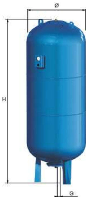
AFE 750 d. 750